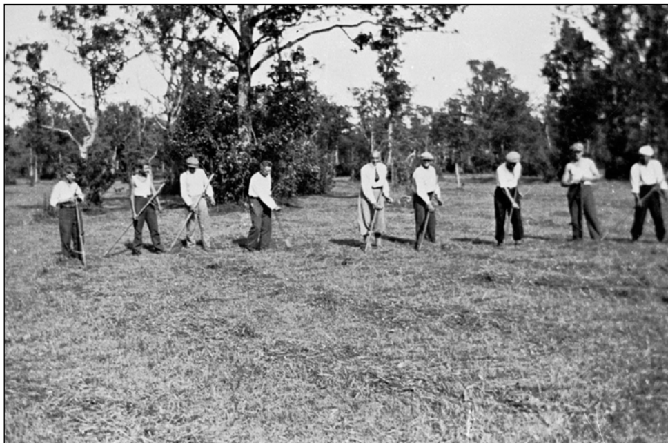
Mehed nõõrimaadel. 1937.

Selle ostutehingu tõttu jäid talumaad Vormsil kruntimata, seepärast kehtis siin ebatavaliselt kaua nõõrimaa-traditsioon. Põllud ja heinamaad olid 1930. aastateni talude vahel jaotatud kitsasteks, kolme-nelja sammu laiusteks siiludeks, karjamaad ja metsad olid enamasti ühised.