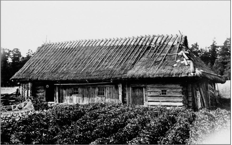
Suitsutare Håkabackanil. 20. sajandi algus. SOV B602139-29.

pereelu keskus. Kambrit kasutati hoiuruumina ning magamiseks. Savipõrandaga toa seinad ja lagi olid suitsust mustunud. Toa eesseinas oli kaks või kolm, tagaseinas üks aken. Ahjust tulev suits juhiti välja madalate uste kaudu, mis olla olnud isegi kasulik, sest sundis ruume iga päev tuulutama.