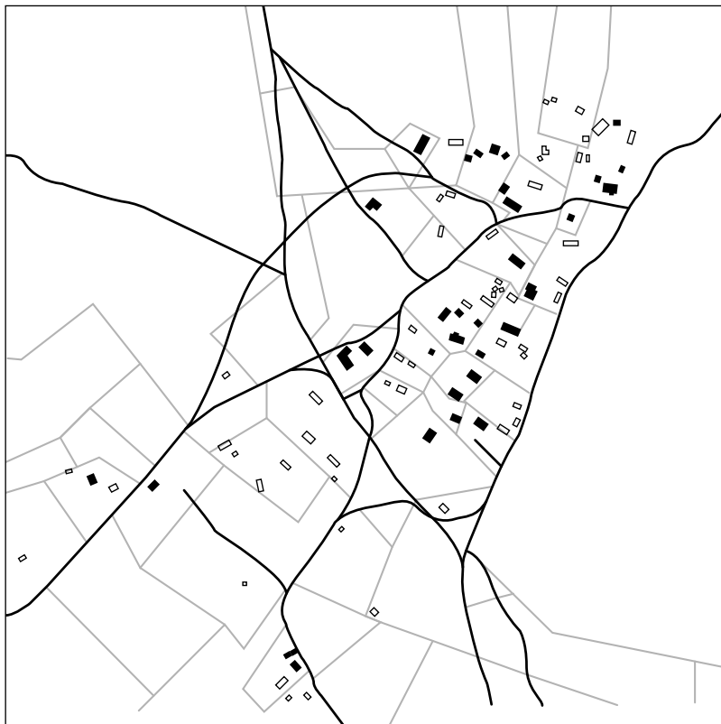
Borby tänapäeval. K. Karine skeem Maa-ameti kaardiserveri järgi. Kontuuriga on tähistatud varemed.