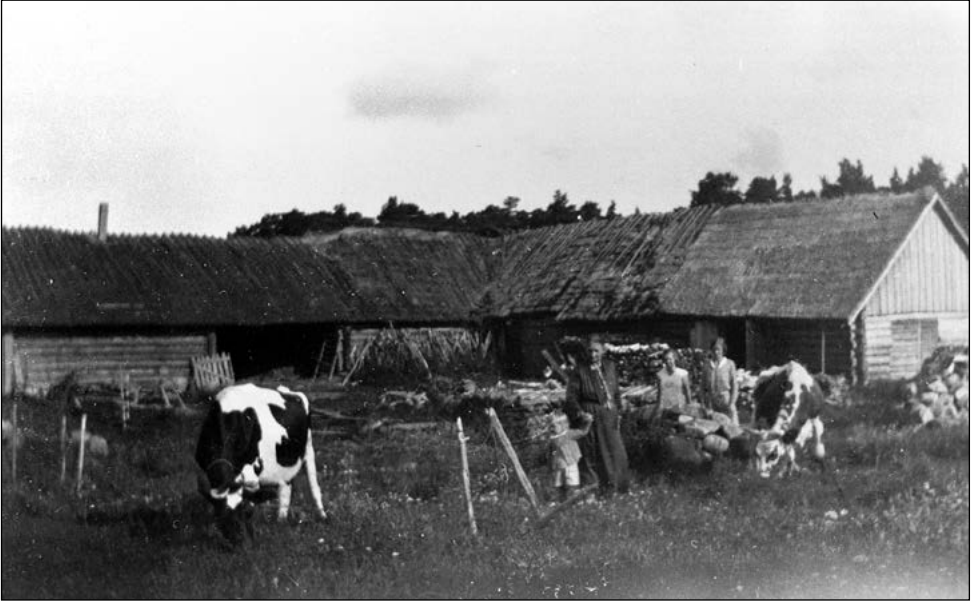
Pöördusega kõrvalhoone. Rumpo. SOV B601142-19.

kasutusala, on neid saarel ka palju säilinud. Parimad näited on Diby Jonase, Uus-Mattase, Vana-Urbase, Vana-Simase; Rälby Masase; Norrby Mangesi.