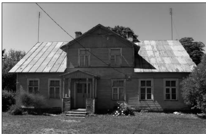
Vormsi elamute tüübid. K. Karine, 2010.