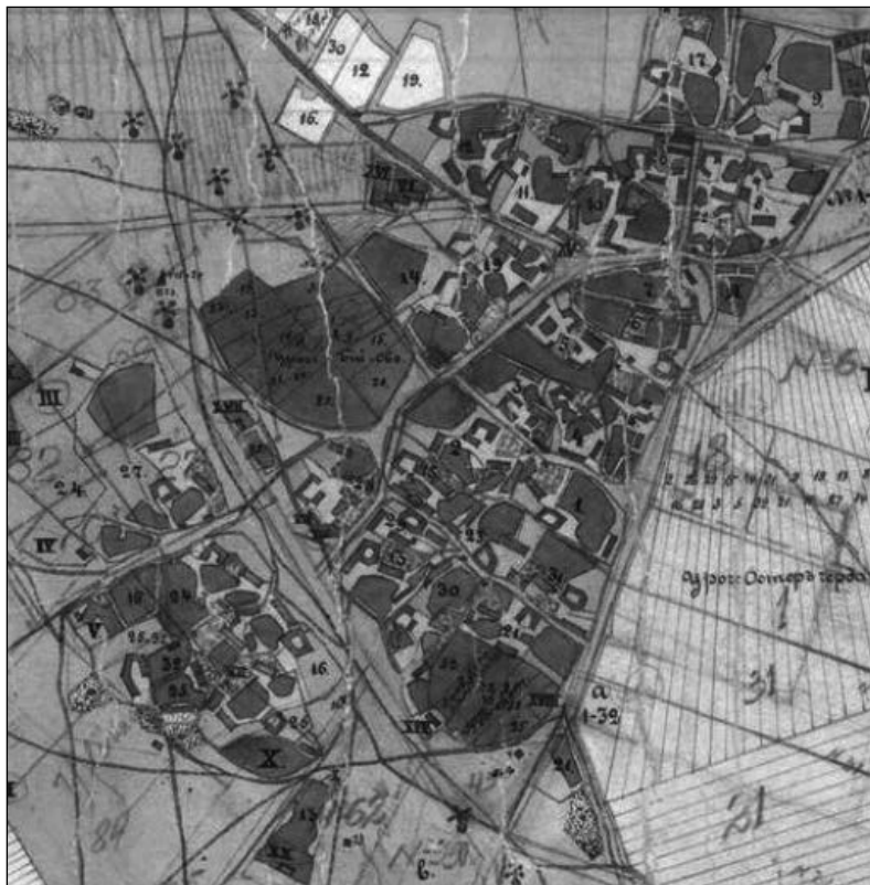
Borby 1899. aastal. EA A.3724.4.820 leht 1.