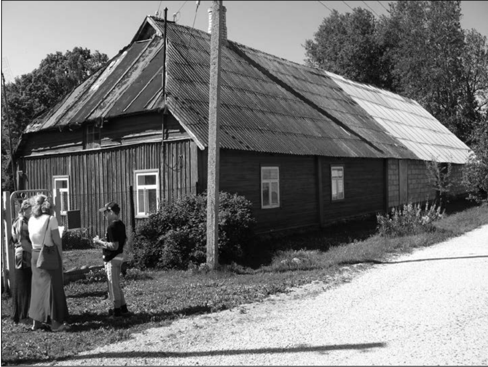
Säilinud on ka üks rehemaja, mis on tänaseks päevaks jäänud ilma rehetoast ja endisaegsest laudvoodrist. Inventeerimine, 2008.

Kaunilt kujundatud aknaid kohtab teisigi. Tähelepanu väärivad ka mansardkorruse aknad, millel on enamalt jaolt kardinad ees, ehkki teist korrust pole kunagi elamiseks valmis ehitatudki. Ülemise korruse eluruumid on vaid vähestes majades ja need on peamiselt suvitajate majutuseks ehitatud külmad toad.