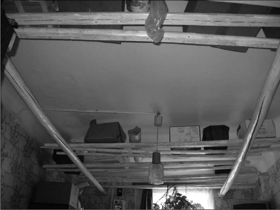
Paljudes majades on kõigisse tubadesse sibulakuivatuseks paigaldatud parred. Inventeerimine, 2008.

sellel ajal Soome eeskujul kiiresti kohvijoomise komme. Kohvile lisati aga kindlasti sigurit. Tänapäevalgi leiab mõnes Varnja majapidamises eraldi kuivateid siguri kuivatamiseks.