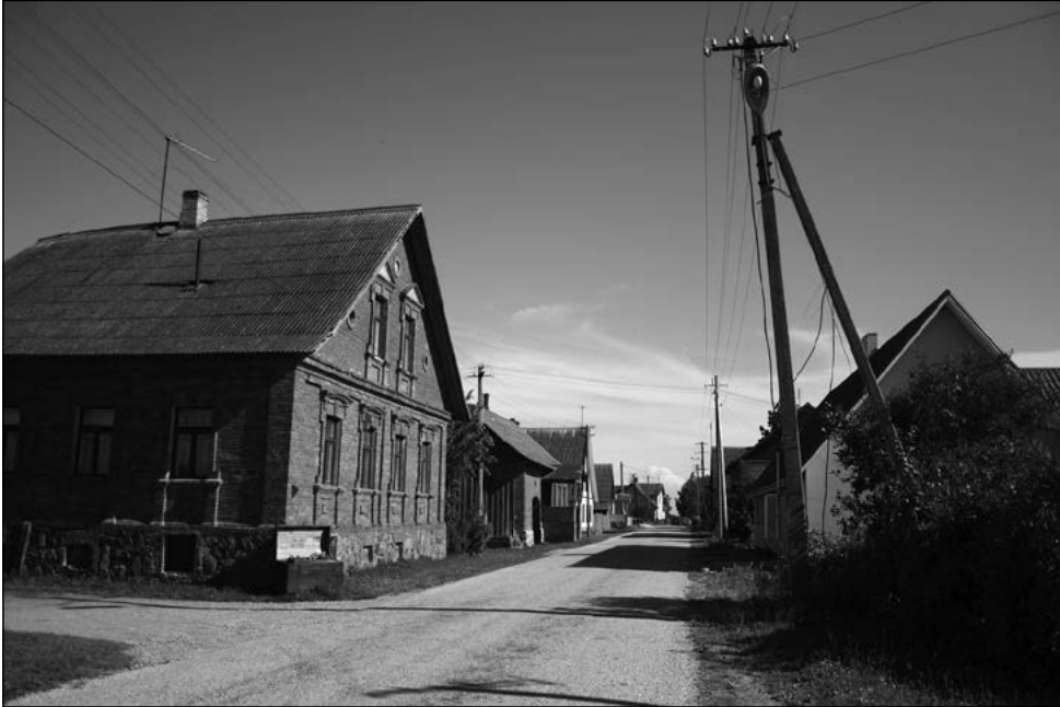
Varnja peatänav ja küla süda – muuseum. E. Lutsepp, 2008.

Kavastu mõisa maadel asuv küla on läbi aegade olnud teiste naaberküladega võrreldes selgemalt segaasustusega ( Puxmep 1976: 11). Elanikkond on läbi aegade koosnenud nii vanausulistest venelastest kui ka luterlastest eestlastest. Varnjast kujunes 18. sajandi lõpuks Peipsimaa fedossejevlaste keskus. 1785. aastal õnnistati sisse avar puidust palvemaja. 1833. aastaks oli Varnja külas ligi 350 eri seisustesse kuuluvat vanausulist ning umbes 100 pärisorja, kogudus loodi 1835. aastal.