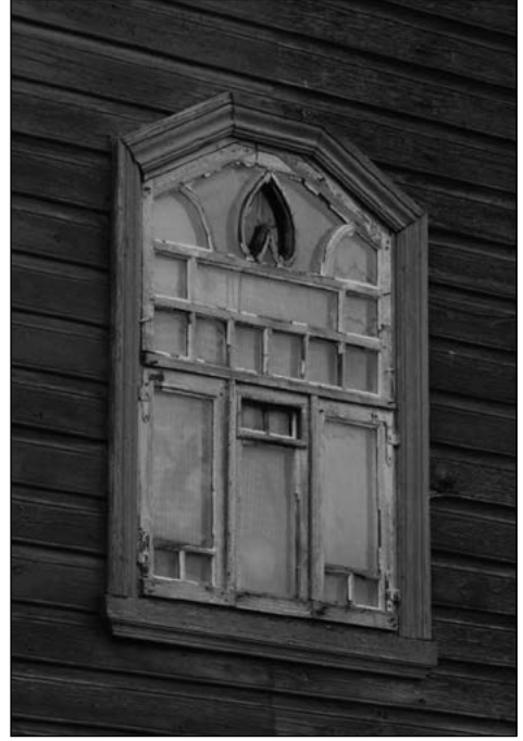
Kaunilt kujundatud aknaid leidub nii kivi- kui puithoonetel. E. Lutsepp, 2008.