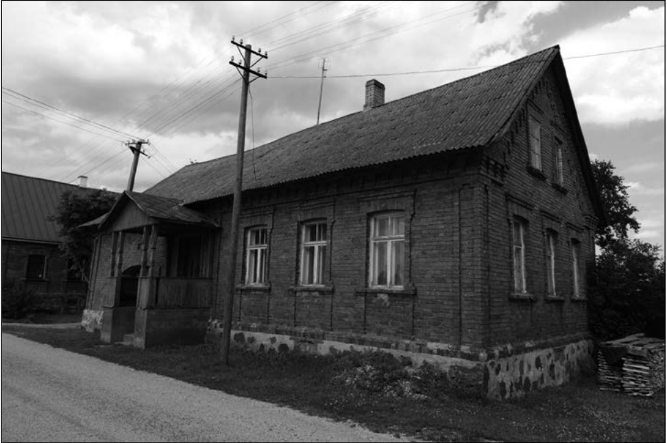
Esinduslikemalt mõjuvad 20. sajandi algul ehitatud punasest tellisest hooned (Lupilovi kinnistu). A. Tarto, 2009.

Tänavküläs tihedalt paiknev hoonestus tekitas aga pideva tulekahjuohu. 19. sajandi lõpust hakati seetõttu aktiivsemalt ehitama ka kohapeal valmistatud punasest tellistest eluhooneid maakivist või puidust kõrvalhoonetega. Laiemalt hakkas see tooni andma alates 1911. aastast, pärast 1910 aset leidnud suuremat tulekahju, mis hävitas hooneid küla tuumikus. Tellishoonete seinad krohviti ja lubjati valgeks või jäeti katmata. Akende raamistus ja karniis (sageli ka nurgaliseenid) jäeti aga krohvimata, moodustades kujunduses erinevate sakmetega mustreid.