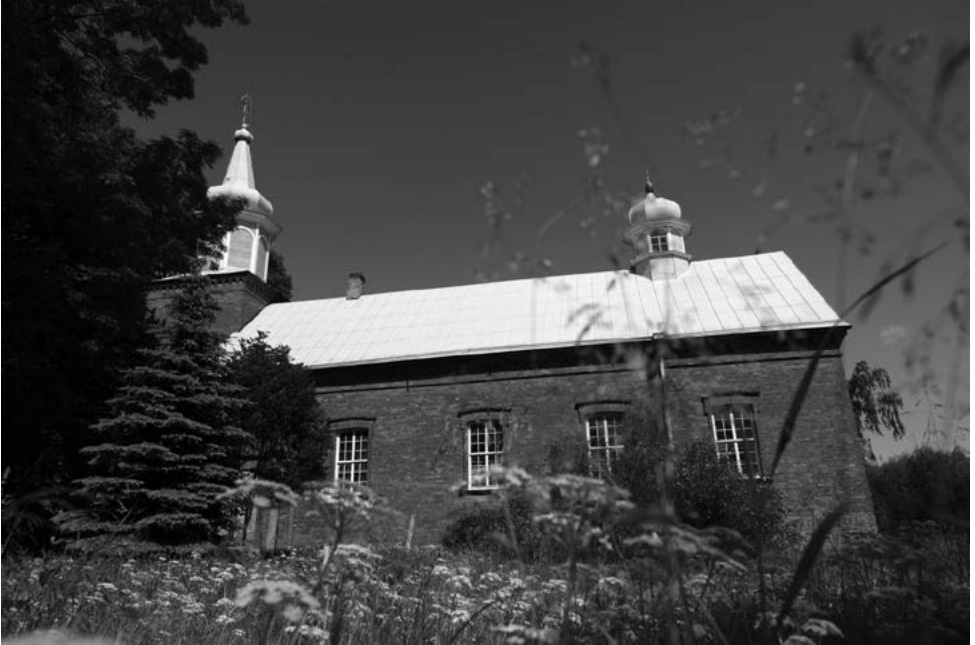
Varnja palvela. A. Tarto, 2009.

ehitati parvedele, mis paigaldati õõtspinnase tõttu. Viietasandilise ikonostaasi maalis Filipp Mõznikov (ikoonid, kroonlühter ja kellad on muinsuskaitse all). 1916. aastaks oli koguduses üle 700 liikme. Sel perioodil kasvas kohalike vanausuliste kirjaoskus. 1910 avati Varnjas postiagentuur ja alates 1913. aastast alustas tööd üheklassiline ministeeriumikool.