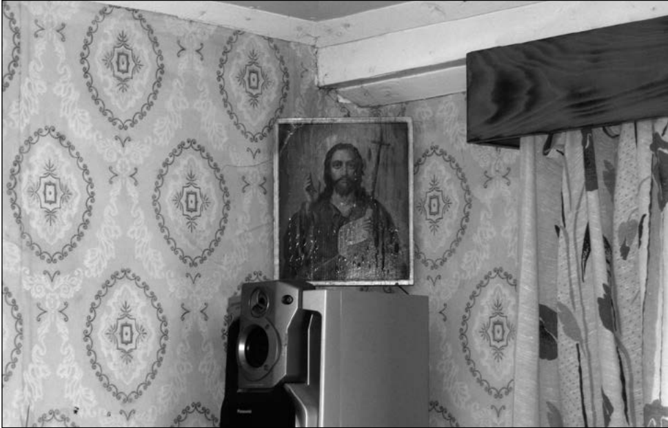
Vähemalt kahel kolmandikul peredel on tänapäevalgi tähtsal kohal ikooninurk. Tänapäevane variant ikooninurgast. Inventeerimine, 2008.

Külas leidub ka uusehitisi. Väga kummaliselt mõjub näiteks Kesktänaval uus kokkupandav ümarpalkidest maja (Järvesuu talu), mis oma üldilmelt erineb küla muust arhitektuurist. Kriitikat on see maja pälvinud ka selle pärast, et omanik kaevas järvest majani kanali. Eelmise sajandi algul oli see aga sealsetes külades tavapärane, niisiis on majaomaniku teguviis igati õigustatud.