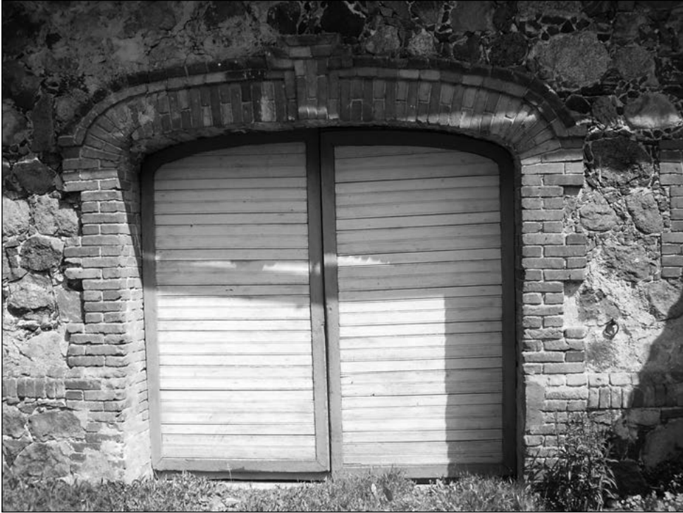
Kaetud õue väravad on pea alati esinduslikult kujundatud. Inventeerimine, 2008.

enam on see probleemiks Mustveest lõuna poole jäävates külades (Raja, Kükita ja Tiheda). Hoone sisemus peidab endas aga kauneid karniisiga kaunistatud lagesid ja valgest kahlist soemüüre ning ležankat. Hoone teine pool, mille välisviimistlust pole uuendatud, annab aga tunnistust maitsekalt paigutatud laudvooderdisest ja viilul näeme selles külas vähe säilinud ehiskonstruktsioone.