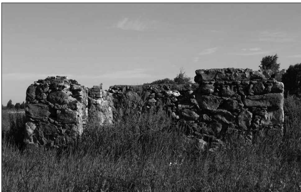
Sepikoja varemed. E. Nassar, 2008.