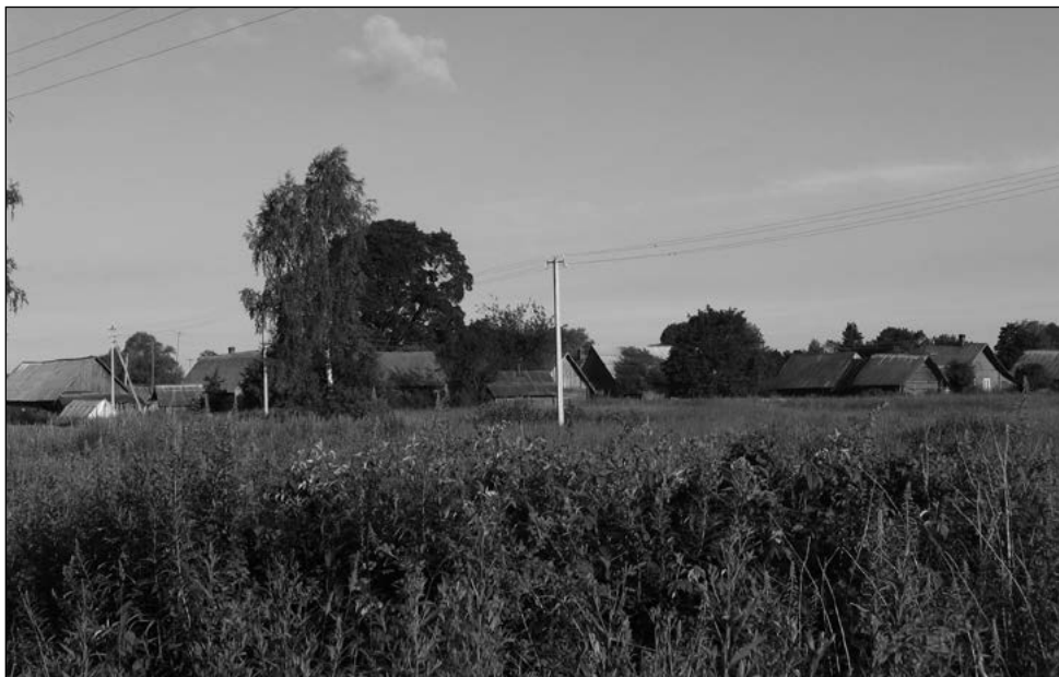
Vaade Lõkova külale. E. Nassar, 2008.