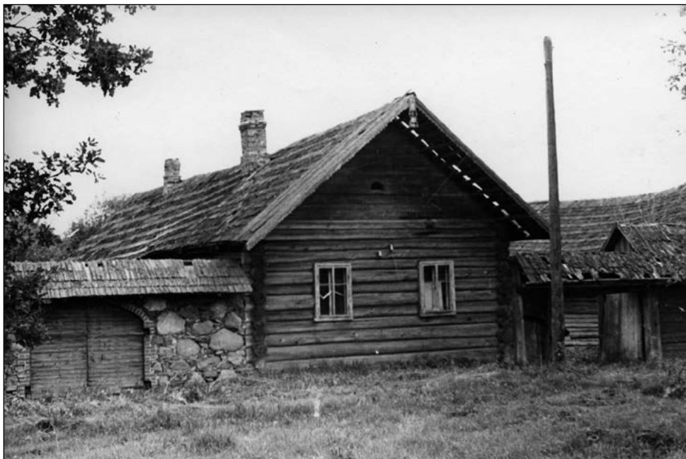
Vanatalu elumaja koos karjajaõue (vasakul) ja puhasõue väravaehitiseaga. H.-L. Paiken. 1979. EVM N 263:4.

porgandit ja sigurit. Ei puudunud ka viljapuuaed 20 noore õunapuu ja eri liiki marjapõõsastega. Paraku jääb selgusetuks, kas tegemist oli osaliselt haritava kooliaia või külakogukonna väljarenditava maaga (ERA f 1831 n 1 s 3958 l 1). Ojavere Algkool olevat edasi tegutsenud ka nõukogude ajal. Kool suleti 1960. aastate lõpul või 1970. aastate algul. Koolimaja pole säilinud. 34