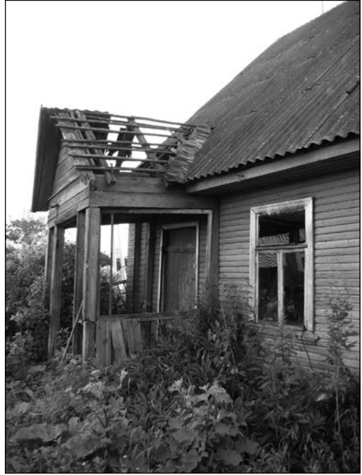
Tühjaks jäänud talu.