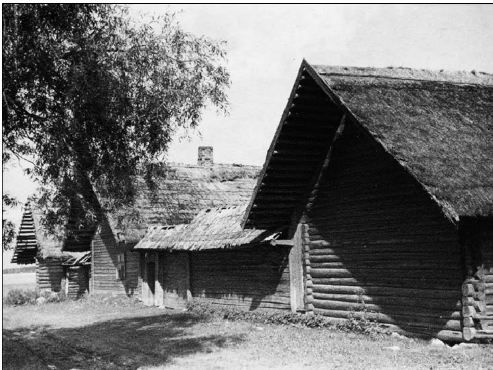
Piiri talu kolmes reas paiknevate hoonetega taluõu. Elumaja ehitatud 1860ndatel aastatel. U. Rips. 1952. ERM Fk 1194:18.